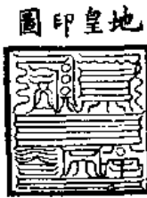
長三寸五分 闊三寸五分