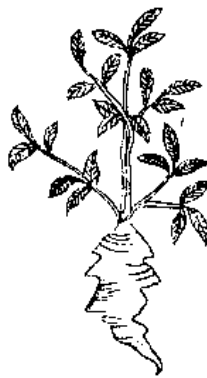
味苦澁微溫無毒主癰疽消腫瘰癧