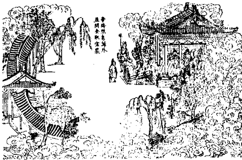
帝時張老城外 並開金殿宮梁

讚曰 稟神幼聖 繼明英聰 咨諫壅水 切淨飾官 如何不納 更事倍崇 預言禍敗 果致早窮